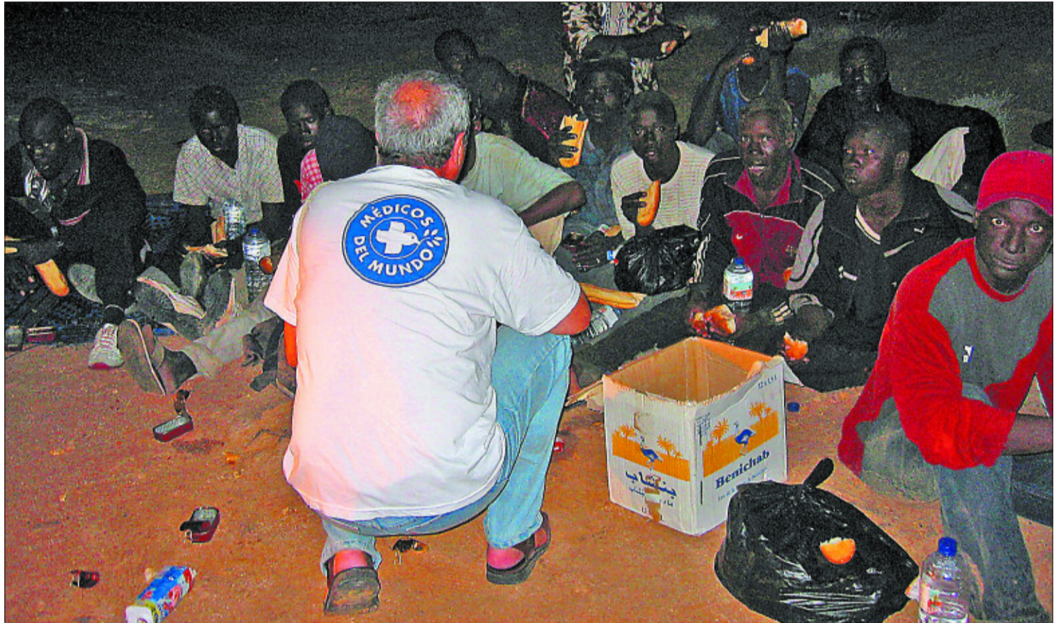
Un miembro de Médicos del Mundo atiende a un grupo de subsaharianos en agosto del año pasado.

Eso es, al menos, lo que se deduce del estudio que la coordinadora de la campaña, la consultora Daryl Upsall Consulting Internacional, llevó a cabo como paso previo a la implantación de la web. De los 800 encuestados a finales del año pasado en todas las comunidades autónomas, sólo el 23% había realizado un testamento por escrito, y nadie había legado a una ONG. Frente a ello, en Estados Unidos los legados suponen el 7% del total de los ingresos de las organizaciones sin ánimo de lucro y en Canadá significan el 4%. Más llamativo es el caso del Reino Unido,