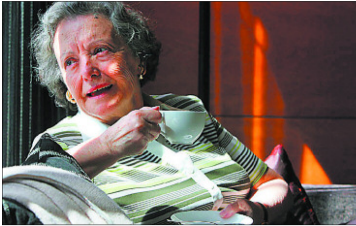
Galiana destaca la satisfacción de sus hijos con el legado.

"En casa vivimos la solidaridad, de manera que ni siquiera se me había pasado por la cabeza que mi marido o mis hijos